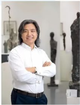
主题宣传画创作者