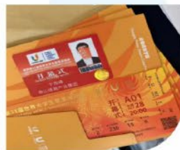
工作证/贵宾证（示例）