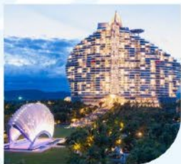
酒店群 (30家运动员入住酒店)